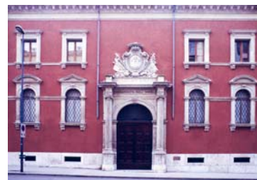
Educandato Statale Agli Angeli