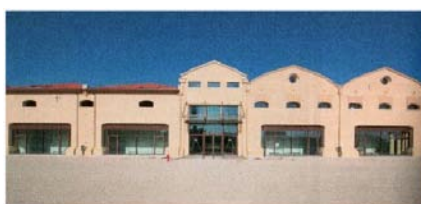
Archivio di Stato di Verona